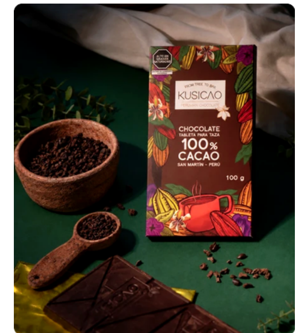
CHOCOLATE 100% CACAO