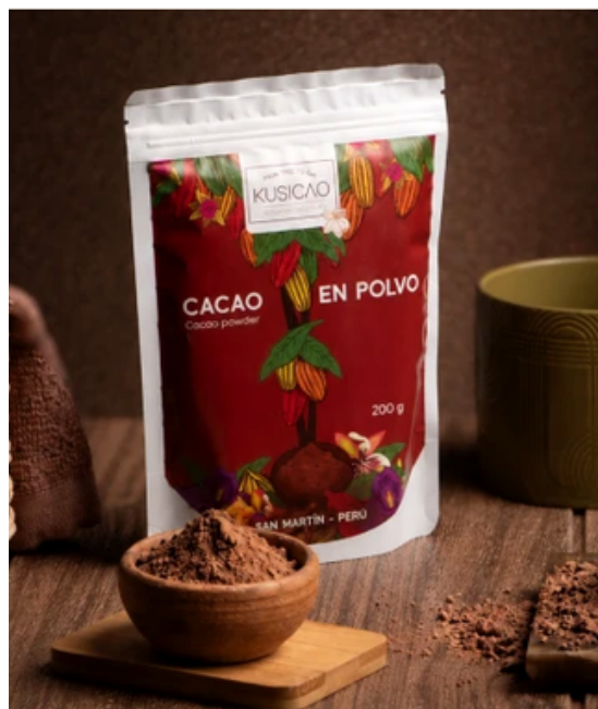
CACAO EN POLVO

Portafolio de chocolates y derivados de cacao peruano de origen, trabajado con enfoque artesanal y presentación premium.