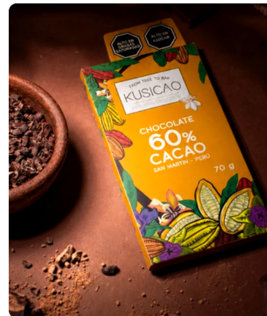
CHOCOLATE 60% CACAO