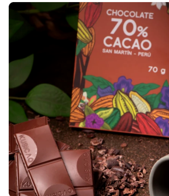
CHOCOLATE 70% CACAO