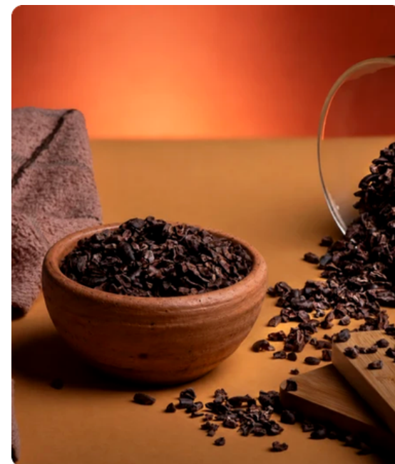
NIBS DE CACAO TOSTADO